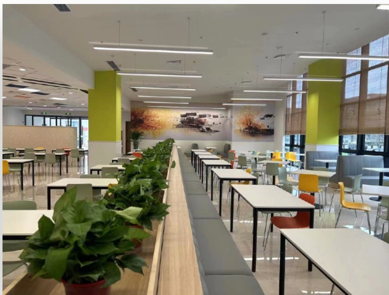
干净卫生用餐环境